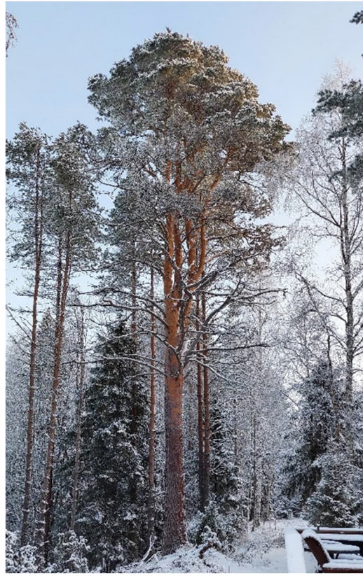
Kuvat 3 & 4: Kohdepuu lännestä ja kaakosta

Puun iästä ei ole tarkkaa tietoa. Yli 70-vuotias naapuri on sanonut käyttäneensä puuta maamerkkinä veneilyssä lapsena ja puu on ollut jo tuolloin kookas, poikkeuksellinen ja silmiinpistävä.