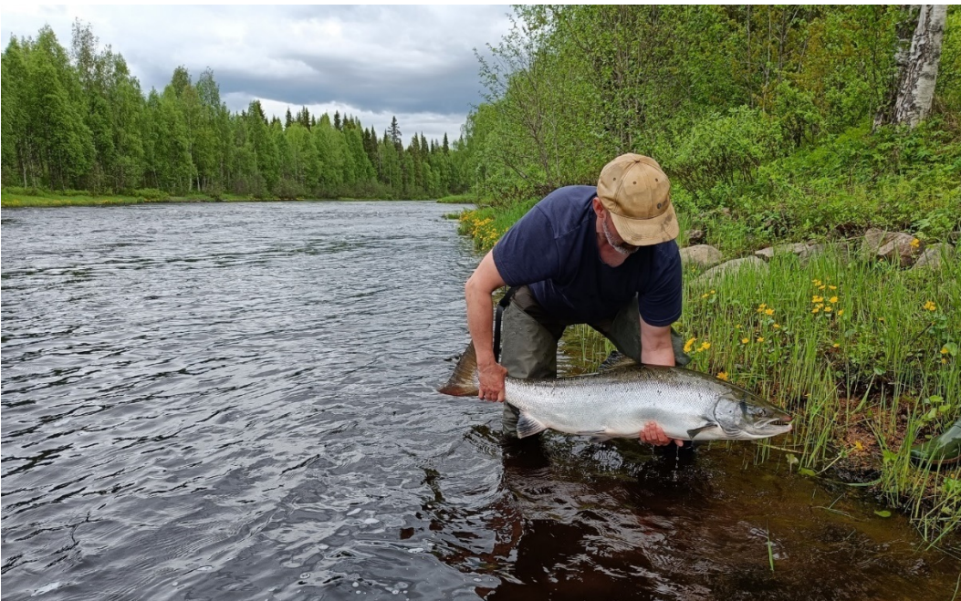
Kuva 10: Ylisiirtolohi Livojoella