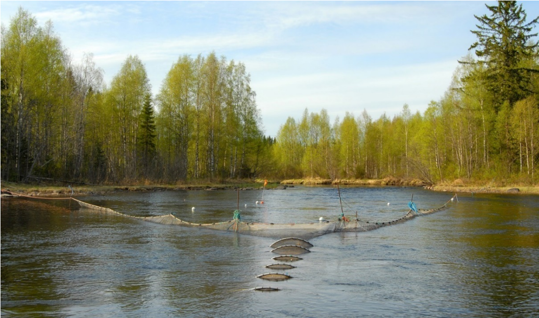
Kuva 1: Smolttiryssä Varisjoella