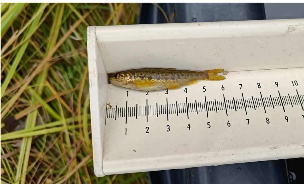
Kuva 7: lijoen sähkökoekalastuksissa saatu kesänvanha lohenpoikanen

Tavoite/tulos: Pienpoikasistutukset tukevat jokeen leimautuneiden lohi- ja meritaimenkantojen syntymistä.