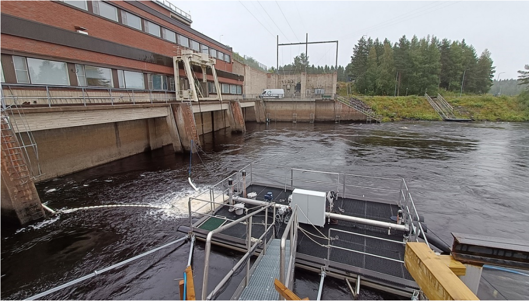
Kuva 9: Kalasydän-kalatie Raasakan voimalaitoksella