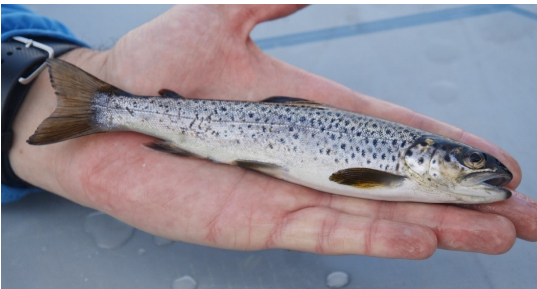
Kuva 4: Taimensmoltti