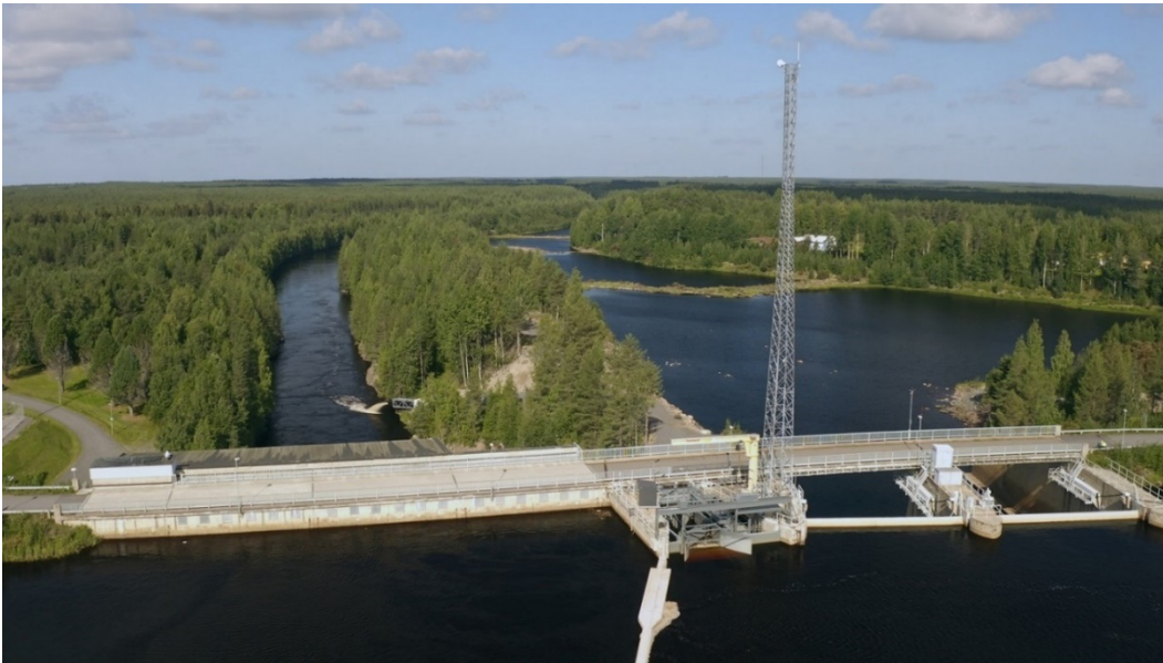
Kuva 5: Smolttien alasvaellusreitti Haapakoskella (ohjausaita ja alasvaellusväylä)

Tavoite/tulos: Toimenpiteen avulla alasvaellusreitin tehokkuus paranee. Rakenteiden modifioinneilla varmistetaan kokonaisuuden toimivuus niin teknisesti kuin kalojen kannalta.