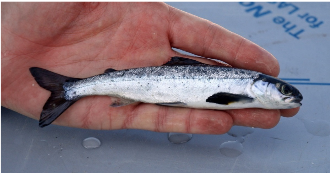
Kuva 3: Lohismoltti

Tavoite/tulos: Toimenpiteen avulla saadaan tärkeää tietoa lohi- ja meritaimensmolttien määristä Haapakoskella, smolttien vaellusajankohdista sekä pienpoikasistutusten ja nousukalojen ylisiirtojen tuloksellisuudesta. Smolttien ylisiirrot tukevat osaltaan lijoen lohien ja meritaimenen luonnonkierron palauttamista. Toimenpide mahdollistaa Toimenpide 1:n tavoitteiden saavuttamisen.