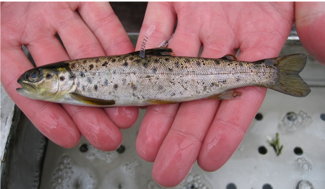
Kuva 2: Streamer-merkitty taimen