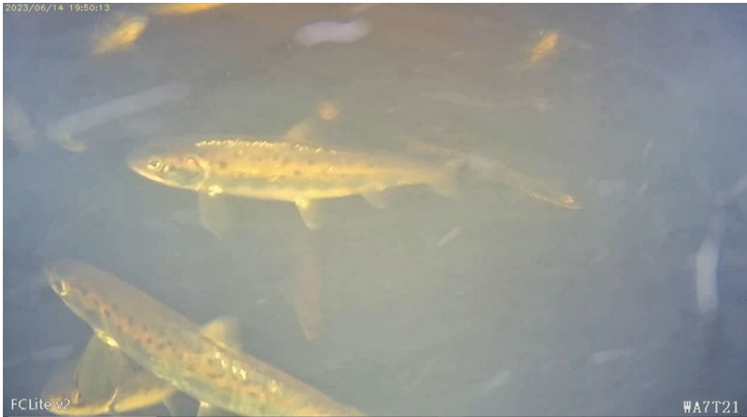
Kuva 6: Lohismoltteja Haapakosken alasvaellusväylän kiinniottolaitteessa