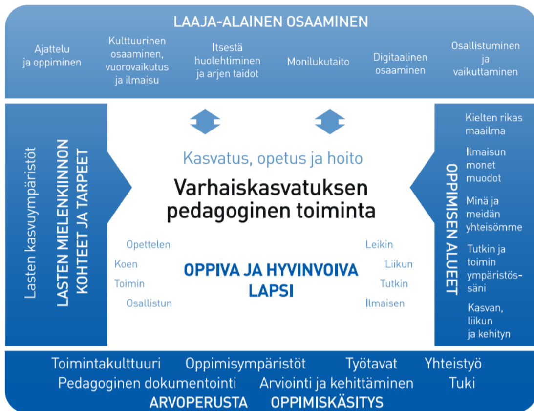
Kuvio 1. Varhaiskasvatuksen pedagogisen toiminnan viitekehys

Varhaiskasvatuksen pedagogista toimintaa ja sen toteuttamista kuvaa kokonaisvaltaisuus. Tavoitteena on edistää lasten oppimista ja hyvinvointia sekä laaja-alaista osaamista (kuvio 1). Pedagoginen toiminta toteutuu lasten ja henkilöstön välisessä vuorovaikutuksessa ja yhteisessä toiminnassa. Lasten omaehtoinen, henkilöstön ja lasten yhdessä ideoima sekä henkilöstön suunnittelema toiminta täydentävät toisiaan. Varhaiskasvatuksen pedagoginen toiminta läpäisee kasvatuksen, opetuksen ja hoidon kokonaisuuden.